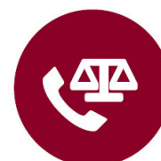
Teléfono de asistencia jurídica