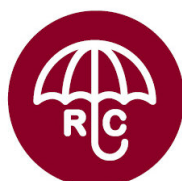
Aumentamos la cobertura del seguro de RC Profesional de A/AT/IE