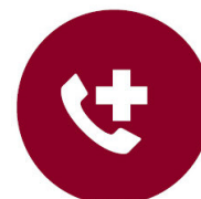
Teléfono de información, orientación y seguimiento médico Covid-19