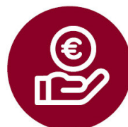
Aplazamos el recibo de tu seguro de RC Profesional de A/AT/IE