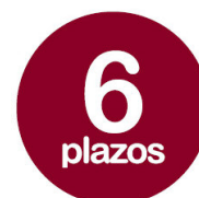
Fraccionamiento en 6 plazos del segundo recibo del seguro de RC Profesional de A/AT/IE